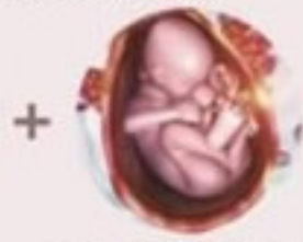
ヒト臍帯血幹細胞順化培養液を配合