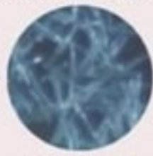
イノスピキュール